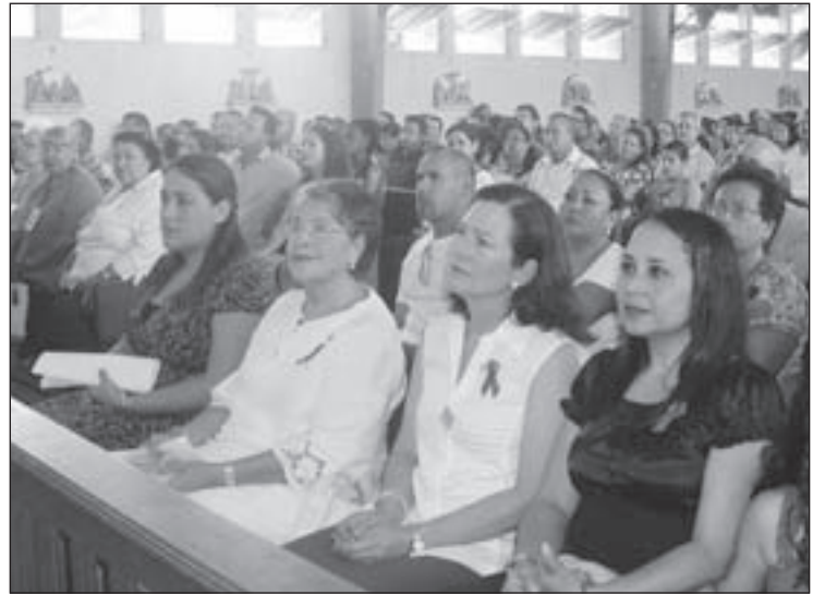
Miembronan di e e Comision di Aids di WCA durante un Santo Sacrificio di Misa na Misa Birgen di Fatima na Dakota pa conmemora e di 29 Aniversario di e Vigilia Internacional di e Victimanan di Aids.

comunidad ta pensa cu no tin Aids, pero lamentablemente si tin Aids na Aruba. Pesey Women's Club of Aruba hunto cu Unesco, fundacion E Faro y IDEFRE a organisa diadomingo ultimo un caminata cu e obhetivo cu henter nos comunidad no solamente a cana hunto cu nan pa deporte, pero tambe pa salud y dignidad pa henter nos comunidad y no exclusivamente pa pashentnan di Aids, pero tambe pa hopi persona cu malesanan cronico pa nan por tin un bida salud y dignidad. □